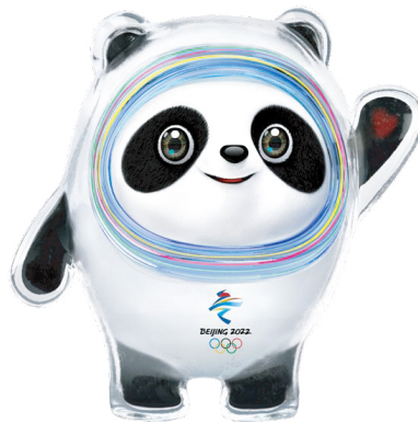
北京 2022 年冬奥会吉祥物 ——冰墩墩