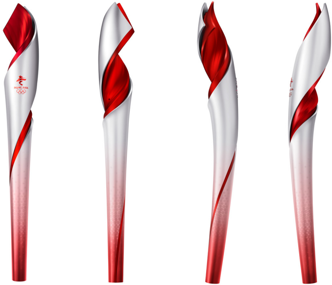
北京 2022 年冬奥会火炬