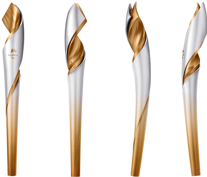
北京 2022 年冬残奥会火炬