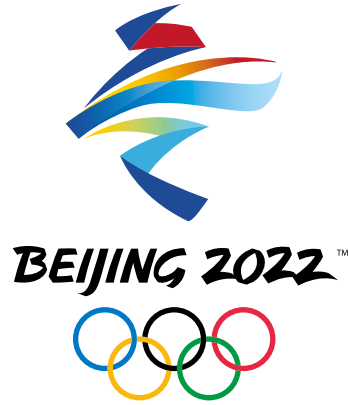
北京 2022 年冬奥会会徽