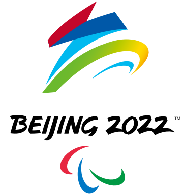
北京 2022 年冬残奥会会徽