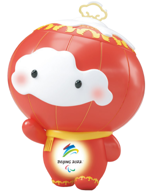
北京 2022 年冬残奥会吉祥物 ——雪容融